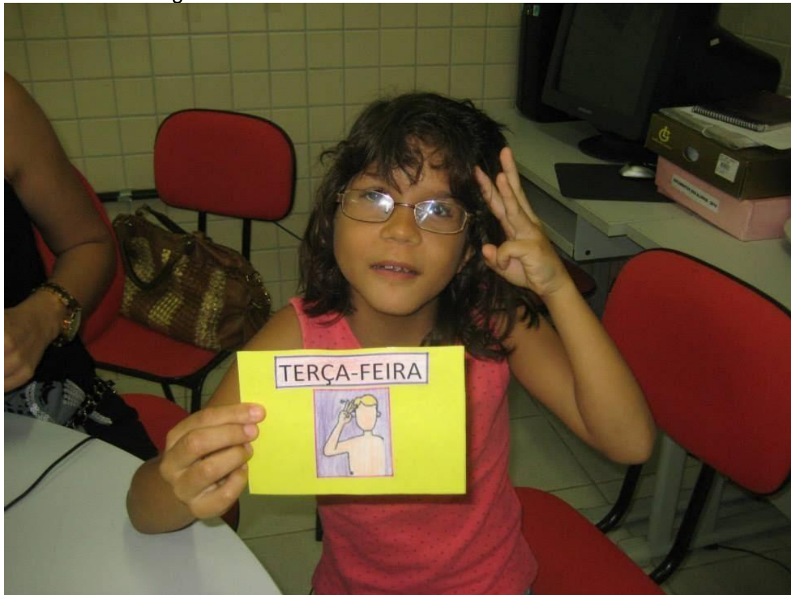
Imagem 5 – Sala de AEE Escola Maria Lúcia Moura Marin/2008

Me lembro que uma vez na escola tinha um colega que me chamava para brincar e eu não entendia o que ele dizia e ele sinalizou brincar e eu entendi. Eu não sabia que eu era surda, não entendia tudo o que acontecia. Tinha muita dificuldade para me comunicar com as pessoas, não sabia me comunicar em Libras e só sabia falar português. Eu já percebia que eu era diferente das outras crianças, quando uma pessoa falava comigo e eu não entendia o que as pessoas falavam.