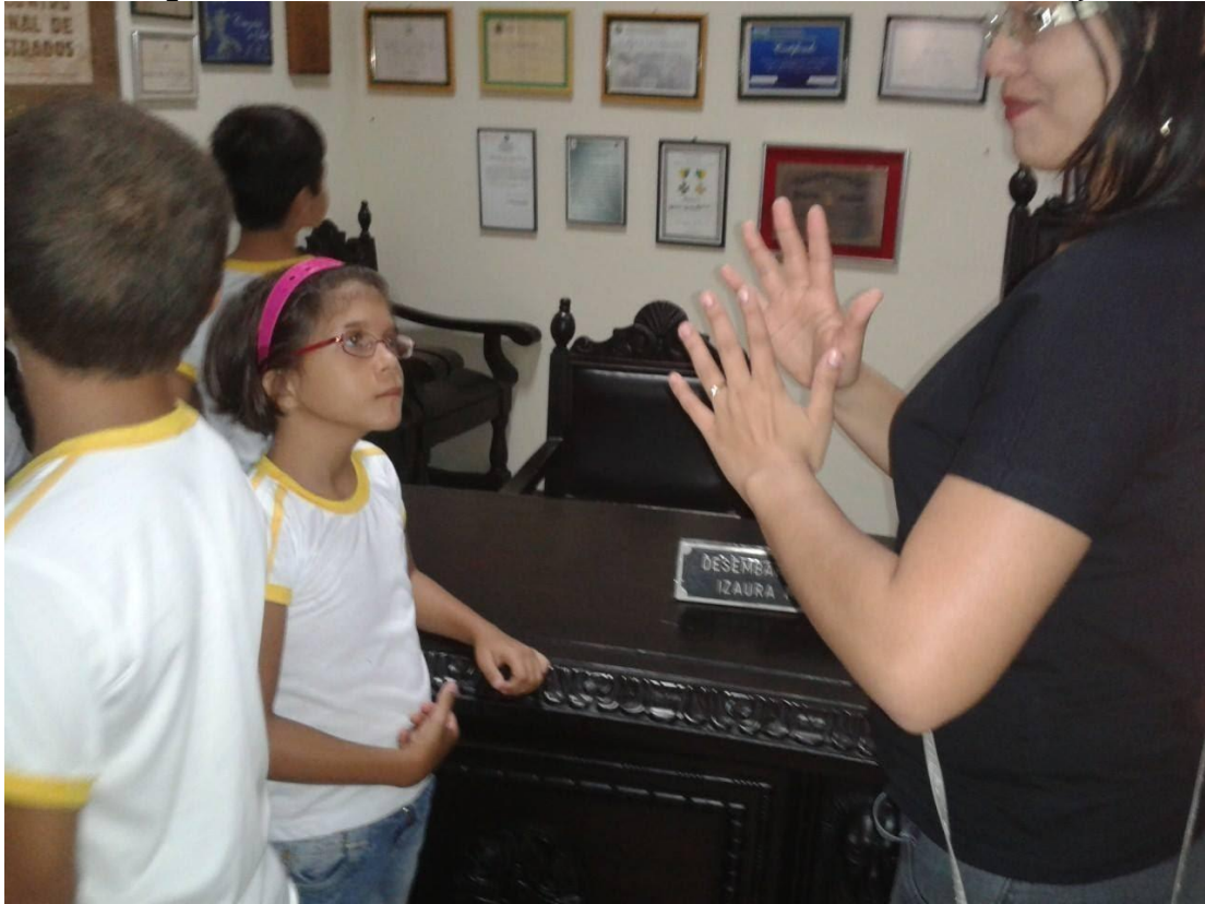
Imagem 6 – Passeio com alunos da Escola Maria Lúcia – Palácio da Justiça

masculino e feminino de cada animal, escrevia o nome de cada animal e sinalizava cada animal, também assistia filme a Arca de Noé.