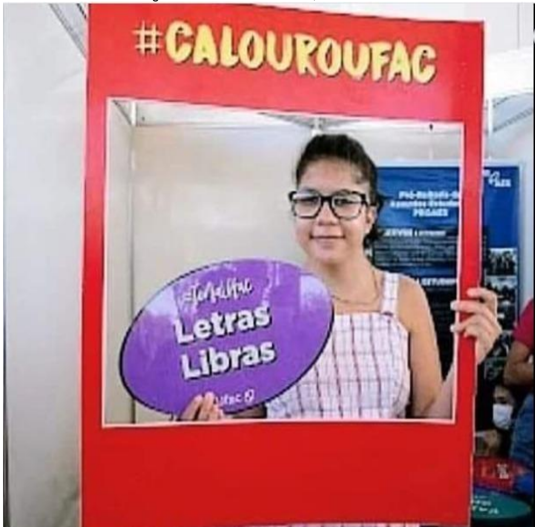
Imagem 8 - Entrada na UFAC, no curso Letras-Libras

Em janeiro de 2022, fui ver o resultado e passei em duas opções, Pedagogia e Letras-Libras. Escolhi Letras-Libras para aprender mais e melhorar comunicação com surdos e ouvintes. Comecei no curso de Letras Libras no segundo semestre de 2022 e talvez terminar o curso em 2026.