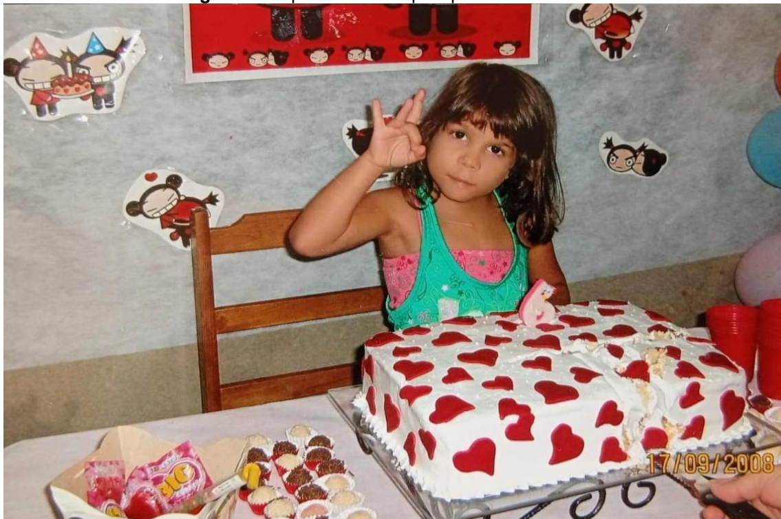
Imagem 4 – O primeiro sinal que aprendi no CEES “eu te amo”