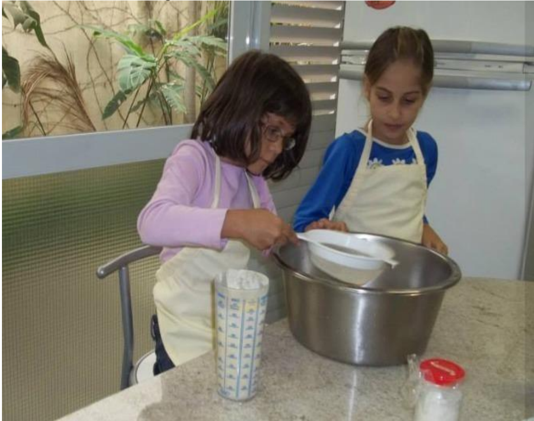
Imagem 3 – Atividade de culinária na ACTC