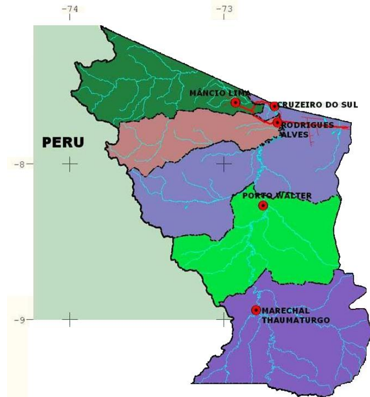
Figura 2. Região do Alto Juruá e seus municípios (ACRE, 2006).

Vale ressaltar ainda que Cruzeiro do Sul (84.335 hab.) está na mesorregião do Vale do Juruá, a qual é composta pelos municípios Mâncio Lima (12.747 hab.); Porto Walter (4.962 hab.); Rodrigues Alves (9.976 hab.); Marechal Thaumaturgo (8.455 hab.), representando assim mais de 120 mil habitantes, equivalendo a 18 % da população do Estado, por si só demonstrando o que representa este contingente populacional naquela região, subsidiando assim informações demográficas, e que associadas com os dados sócio-econômicos, em muito podem contribuir com as políticas públicas, mais particularmente, nas áreas da Saúde e da Educação (IBGE, 2006).